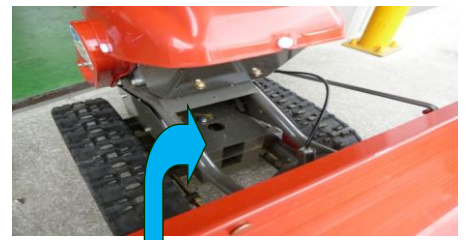
②ウエイトセット：タンク下(18kg)