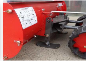
ガイドスレッドセット 接地面を傷つけない為の部品