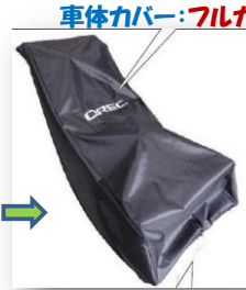
車体カバー：フルカバー