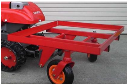
運搬用キャリア：コンテナ2個分の積載量 を選べるキャリア