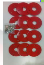
①ウエイトセット 転輪部12kg