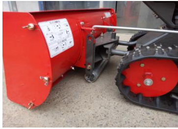
ガイドローラーセット 接地面を傷つけない為のローラー