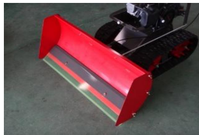
ゴムスクレッパーセット ：接地面 を傷つけない為のゴム製部品